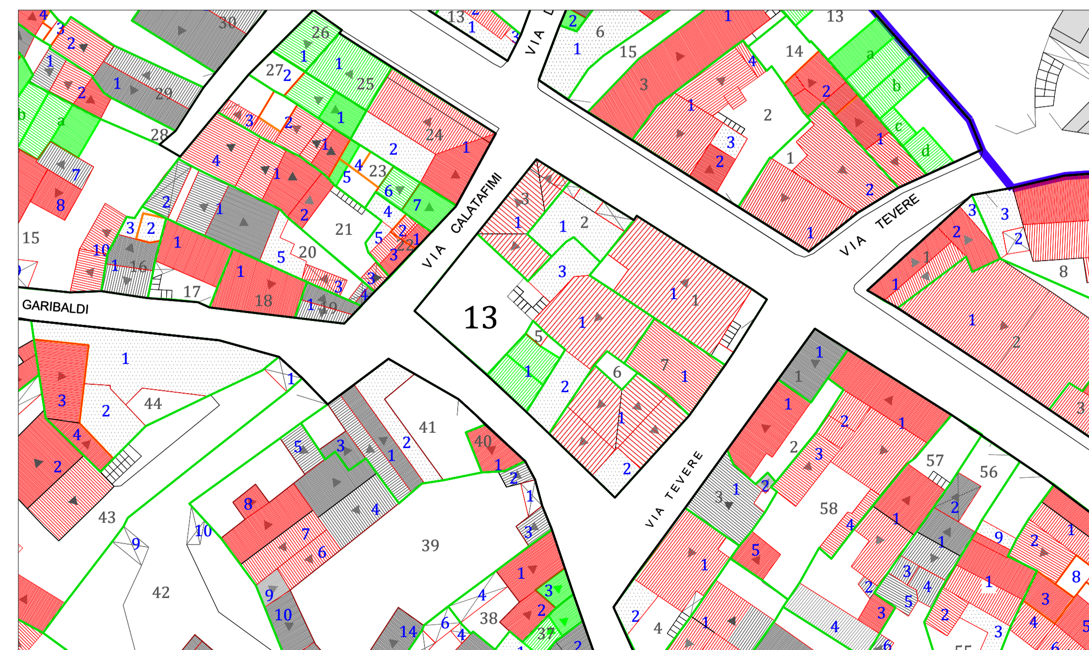
Stralcio della planimetria di progetto (scala 1:500)